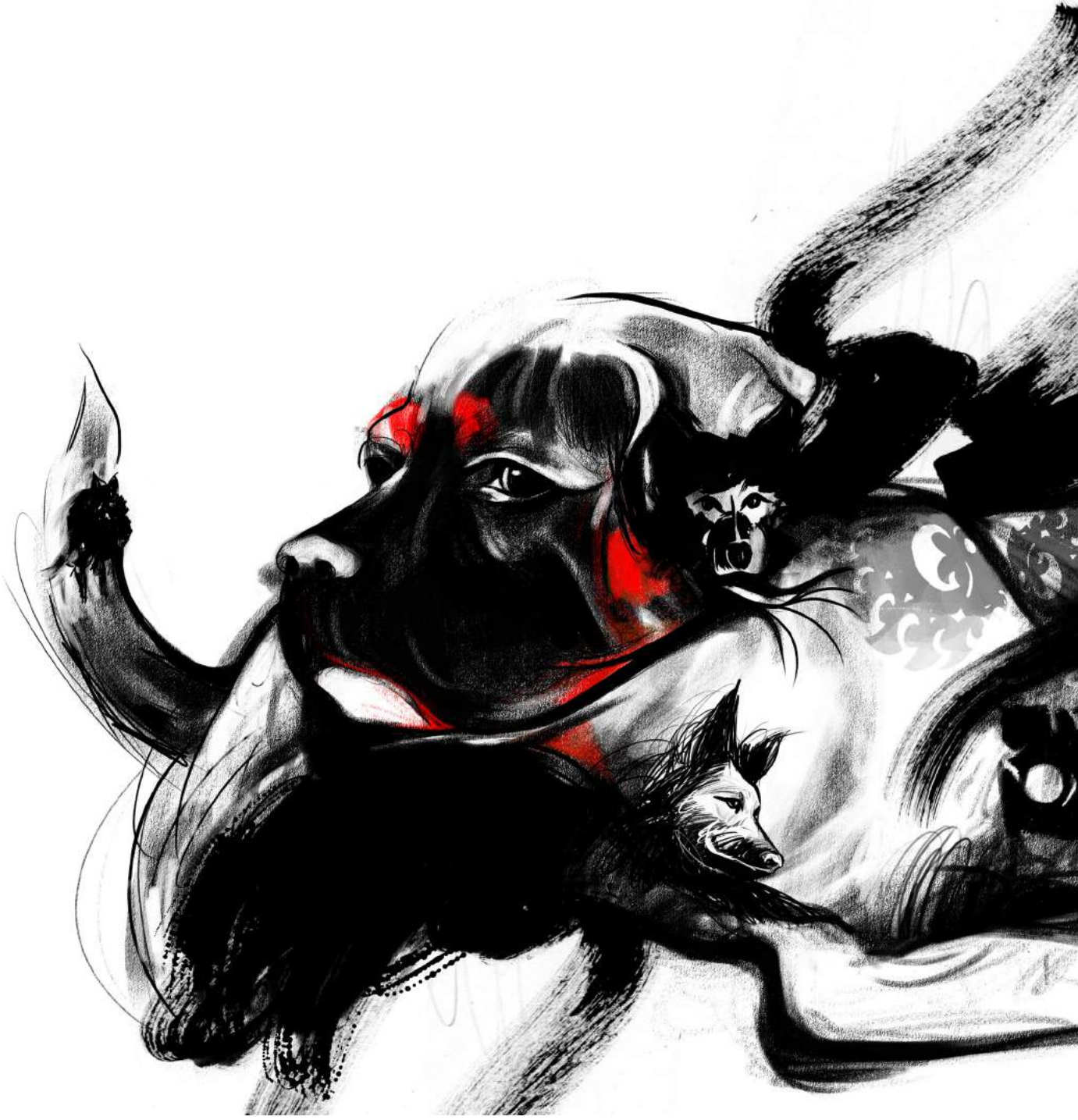
7 > "hükümrân" , 140x80 cm, Karışık Teknik, Kağıt Üzerine Baskı, 2016. "sovereign" , 140x80 cm, Mixed Media, Print on Paper, 2016.